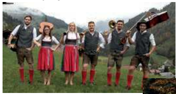
Die jungen Großarler

12.09.20 | 10.30-13.30h Seewies'n Musi Platz: Arkaden des Heimatwerkes Gruppenleiter: Erich Harlander